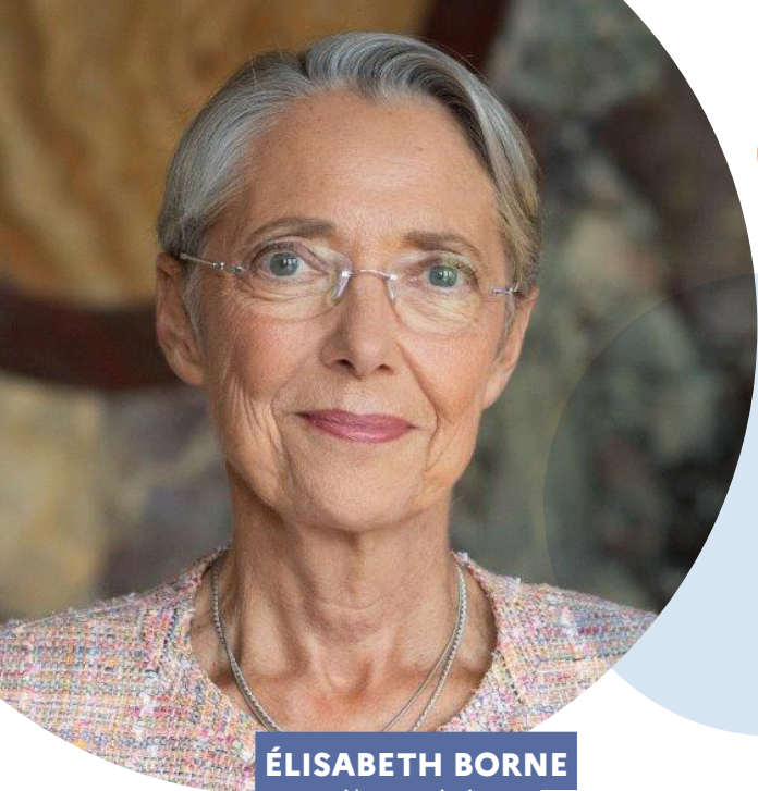
ÉLISABETH BORNE Première ministre

12 millions de Français sont touchés par le handicap. C'est un conjoint, un parent, un enfant, un proche. Ce sont des millions de familles, surtout.