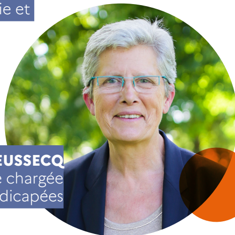
GENEVIÈVE DARRIEUSSECQ Ministre déléguée chargée des Personnes handicapées