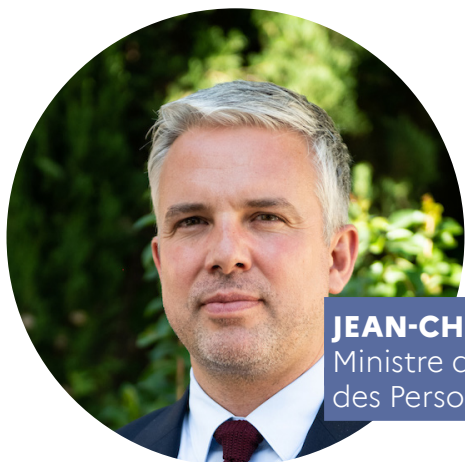
JEAN-CHRISTOPHE COMBE Ministre des Solidarités, de l'Autonomie et des Personnes handicapées

Cette méthode est exigeante, mais nous tenons à réaffirmer avec force qu'elle est la seule qui puisse être à la hauteur des attentes des personnes en situation de handicap.